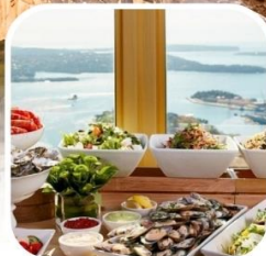
SKYFEAST BUFFET SYDNEY TOWER