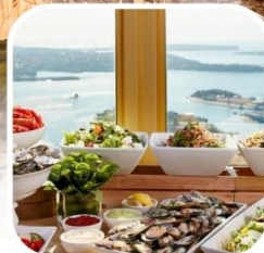
SKYFEAST BUFFET SYDNEY TOWER