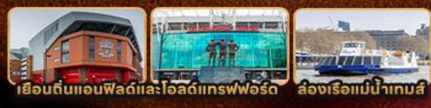
เยือนถิ่นแอนฟิลด์และโอลด์แทรฟฟอร์ด ส่องเรือแม่น้ำเทมส์

London Stonehenge Liverpool Manchester Stratford Upon Avon