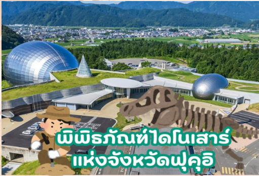
พิพิธภัณฑ์ไดโนเสาร์ แห่งจังหวัดฟุกุคิ