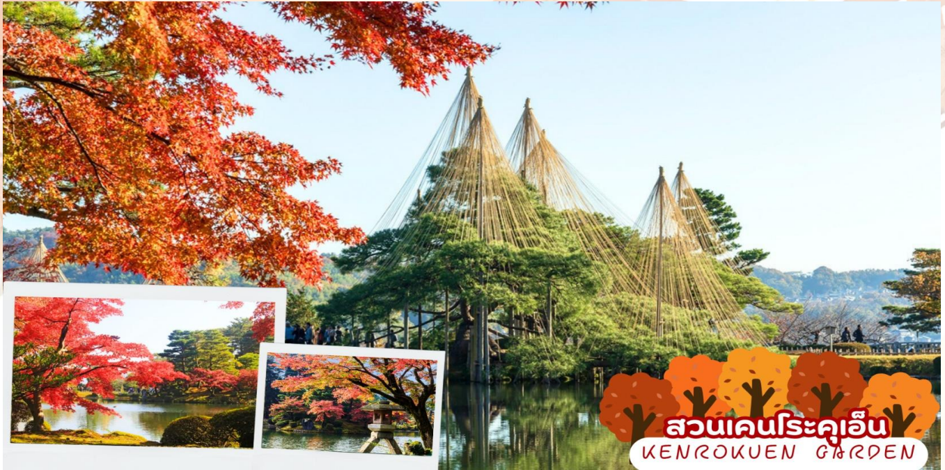
สวนเคนโรคุเอ็น KENROKUEN GARDEN

นำท่านชม สวนเคนโรคุเอ็น (Kenrokuen Garden) ได้รับการชื่นชมให้เป็นหนึ่งใน 3 สวนที่งดงามที่สุดของญี่ปุ่น ถือเป็นสถานที่ที่คุณต้องมาให้ได้เมื่อมาเยือนคานาซาวะ “สวนเคนโรคุเอ็น” แปลว่า “สวนที่รวมไว้ซึ่งหกคุณลักษณะ” หกคุณลักษณะดังกล่าว ได้แก่ ความกว้างขวาง, ความเงียบสงบ, การสร้างสรรค์โดยมนุษย์, ความเก่าแก่โบราณ, แหล่งน้ำและทิวทัศน์ที่งดงาม หนึ่งในจุดที่น่าตื่นตะลึงที่สุดของสวนเคนโรคุเอ็นคือบ่อน้ำขนาดใหญ่ที่สร้างขึ้นชื่อ “คะสึมิกะอิเซะ” บริเวณกลางสระมีเกาะโฮไร บ่อน้ำแห่งนี้สร้างขึ้นเพื่อใช้เป็นสัญลักษณ์สื่อถึงการมีชีวิตยืนยาวและความรุ่งเรืองไม่มีที่สิ้นสุดของผู้ปกครองที่ดิน นอกจากนี้ ยังมีจุดอื่นๆในสวนอีกมากที่คุณสามารถชื่นชมได้ ไม่ว่าจะเป็นเหล่าดอกไม้ต้นไม้ เช่น ดอกบ๊วยและดอกซากุระที่บานในฤดูใบไม้ผลิ ดอกอาซาเลียและดอกไอริชในช่วงต้นฤดูร้อน และใบไม้สีแดงและเหลืองในฤดูใบไม้ร่วง ช่วงฤดูหนาว คุณจะได้ชื่นชมทิวทัศน์ที่ปกคลุมด้วยหิมะ (การเปลี่ยนสีของใบไม้ในฤดูใบไม้ร่วง ขึ้นอยู่กับสภาพอากาศ)