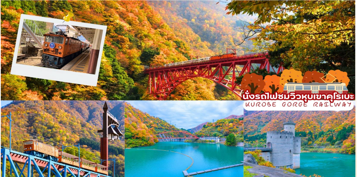
นั่งรถไฟชมวิวนหุบเขาคุโรเบะ KUROBE GORGE RAILWAY

นั่งรถไฟชมวิวนหุบเขาคุโรเบะ (Kurobe Gorge Railway) รถไฟโทโรโกะ คุณจะสัมผัสกับธรรมชาติอันอุดมสมบูรณ์ ป่าไม้เขียวขจี สายน้ำไหลเย็น และหน้าผาสูงชัน ไฮไลท์ของการนั่งรถไฟโทโรโกะ คือสามารถเพลิดเพลินกับวิวทิวทัศน์อันงดงามจากหน้าต่างรถไฟ ซึ่งนอกจากสายน้ำใสสะอาดของแม่น้ำคุโรเบะแล้ว ยังสามารถเพลิดเพลินกับวิวทิวทัศน์ของธรรมชาติที่เปลี่ยนแปลงไปตามแต่ละฤดูกาล ในระหว่างทางคุณจะได้สัมผัสกับความงามของธรรมชาติตลอดเส้นทาง