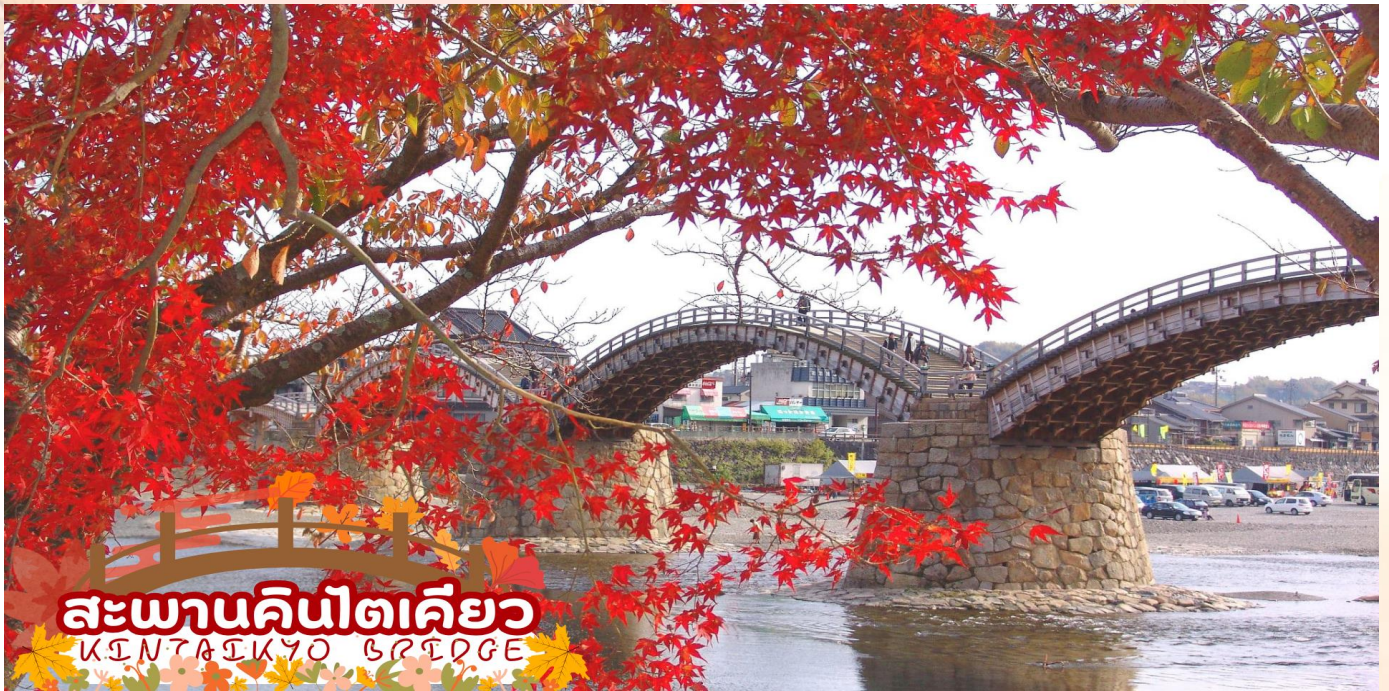
สะพานคินไตเคียว KINTAI KYO BRIDGE

ชมความงามของ สะพานคินไตเคียว (Kintai Kyo Bridge) สะพานไม้ 5 โค้ง 1 ใน 3 สะพานที่สวยงามที่สุดในญี่ปุ่น สร้างครั้งแรกเมื่อปี พ.ศ. 2216 แต่พังทลายลงในปีต่อมา จึงได้มีการสร้างขึ้นใหม่และอยู่มายาวนานกว่า 270 ปีจนกระทั่งถึง พ.ศ. 2493 สะพานแห่งนี้ได้พังทลายเพราะถูกพายุไต้ฝุ่นคิโยะพัดทำลาย ชาวเมืองอิวาคุนิเลยพร้อมใจกันสร้างสะพานขึ้นมาใหม่อีกครั้งตามรูปแบบเดิม (ใบไม้เปลี่ยนสีขึ้นอยู่กับสภาพอากาศ)