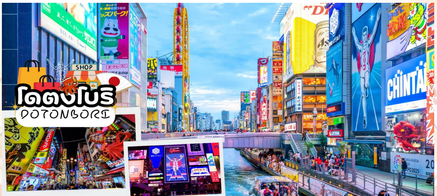
โดตงโบริ DOTONBORI

พาท่าน ช้อปปิ้งโดตงโบริ (Dotonbori) นั้น ถือว่าเป็นแหล่งช้อปปิ้งที่มีชื่อเสียงมากที่สุดของจังหวัดโอซาก้า และยังถือเป็นแหล่งช้อปปิ้งที่มีความโรแมนติกอีกด้วย เพราะย่านโดตงโบริที่เป็นแหล่งช้อปปิ้งนั้น ไม่ได้มีขนาดใหญ่เหมือนกับแหล่งช้อปปิ้งที่อื่นๆ จะเป็นเพียงถนนสายเล็กๆ ที่อยู่เลียบบคลองโดตงโบริ ในช่วงเย็นๆของถนนสายนี้จะดูคึกคัก เต็มไปด้วยแสงสี และเสียงจากป้ายไฟโฆษณาต่างๆ ที่อยู่ทั้งบนตึกและริมแม่น้ำ ผู้คนส่วนใหญ่นั้นเป็นนักท่องเที่ยวต่างชาติ และชาวญี่ปุ่นเอง จะมาเดินช้อปปิ้ง มาทานอาหารเพื่อตีความกับบรรยากาศแบบนี้กันเป็นจำนวนมาก จุดที่พลาดไม่ได้ ของย่านโดตงโบรินี้ ก็คือ ป้ายไฟกูลิโกะ ซึ่งเป็นที่รู้จักกันอย่างมากมายบริเวณสะพานเอบิซุ