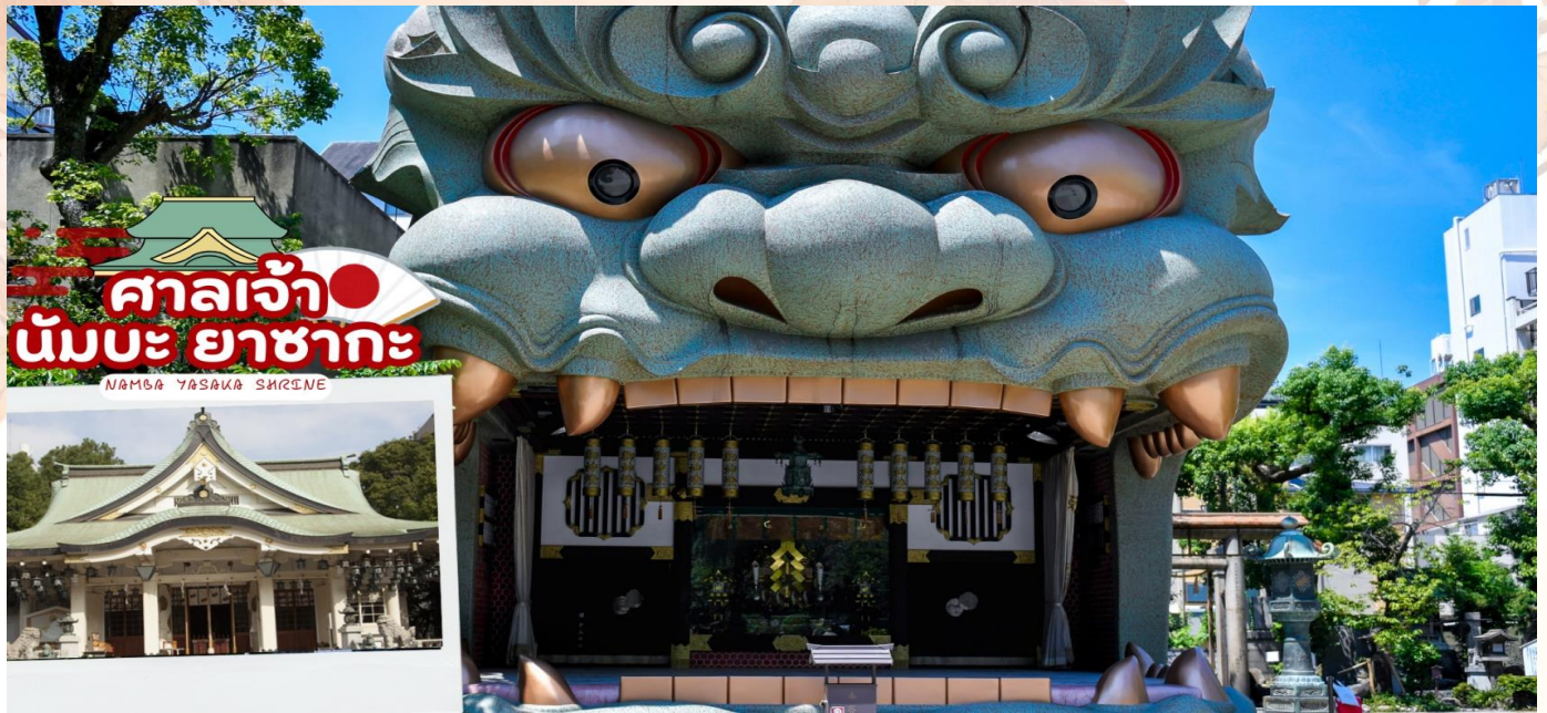
ศาลเจ้า นัมบะ ยาสากะ NAMBA YASAKA SHRINE

พาท่าน ช้อปปิ้งโดตงโบริ (Dotonbori) นั้น ถือว่าเป็นแหล่งช้อปปิ้งที่มีชื่อเสียงมากที่สุดของจังหวัดโอซาก้า และยังถือเป็นแหล่งช้อปปิ้งที่มีความโรแมนติกอีกด้วย เพราะย่านโดตงโบริที่เป็นแหล่งช้อปปิ้งนั้น ไม่ได้มีขนาดใหญ่เหมือนกับแหล่งช้อปปิ้งที่อื่นๆ จะเป็นเพียงถนนสายเล็กๆ ที่อยู่เลียบบคลองโดตงโบริ ในช่วงเย็นๆของถนนสายนี้จะดูคึกคัก เต็มไปด้วยแสงสี และเสียงจากป้ายไฟโฆษณาต่างๆ ที่อยู่ทั้งบนตึกและริมแม่น้ำ ผู้คนส่วนใหญ่นั้นเป็นนักท่องเที่ยวต่างชาติ และชาวญี่ปุ่นเอง จะมาเดินช้อปปิ้ง มาทานอาหารเพื่อตีความกับบรรยากาศแบบนี้กันเป็นจำนวนมาก จุดที่พลาดไม่ได้ ของย่านโดตงโบรินี้ ก็คือ ป้ายไฟกูลิโกะ ซึ่งเป็นที่รู้จักกันอย่างมากมายบริเวณสะพานเอบิซุ