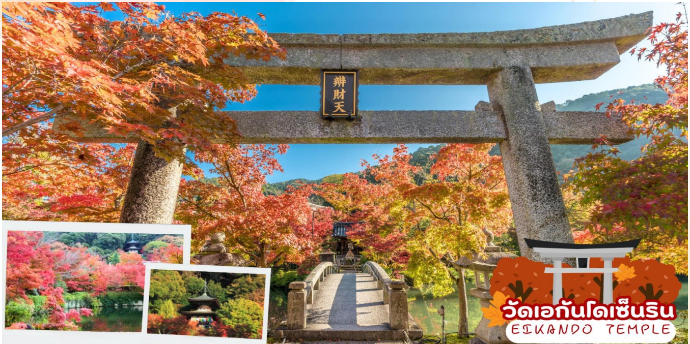
วัดเอกันโดเซ็นริน EIKANDO TEMPLE

ออกเดินทางสู่ เมืองเกียวโต (Kyoto) ซึ่งในอดีตเคยเป็นเมืองหลวงของประเทศญี่ปุ่น และยาวนานที่สุดคือ ตั้งแต่ปี ค.ศ. 794 จนถึง 1868 รวม ๆ 1,100 ปีเลยทีเดียว เมืองเกียวโตจึงเป็นเมืองที่มีสถานที่สำคัญ ๆ ที่เต็มไปด้วยประวัติศาสตร์และวัฒนธรรมดั้งเดิมของญี่ปุ่น