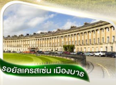
รอยัลคราเซน เมืองบาร