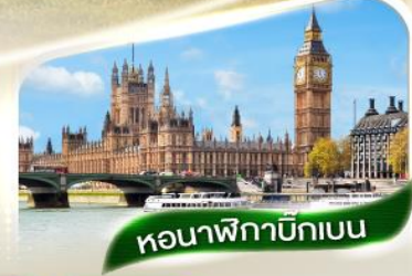
หอนาฬิกาบิ๊กเบน