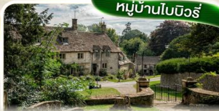
หมู่บ้านโบนิวรี่