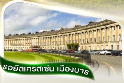
รอยัลเครสเซน เมืองบาส