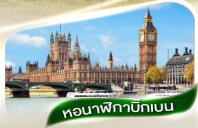
หอนาฬิกาบิกเบน