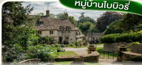
หมู่บ้านไบบิวรี่