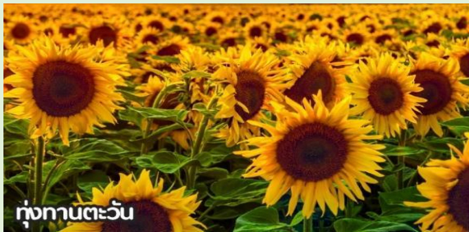
ทุ่งทานตะวัน