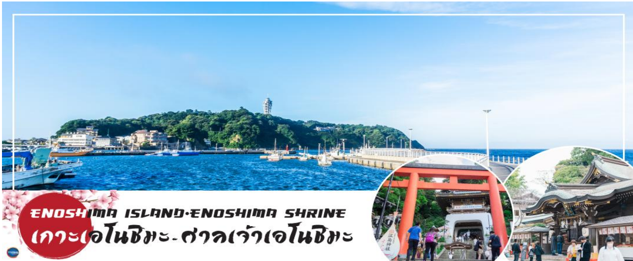
ENOSHIMA ISLAND-ENOSHIMA SHRINE เกาะเอโนชิมะ-ศาลเจ้าเอโนชิมะ

08.00 น. เดินทางถึง ท่าอากาศยานนานาชาตินาริตะ ประเทศญี่ปุ่น นำท่านผ่านขั้นตอนการตรวจคนเข้าเมืองและศุลกากร เรียบร้อยแล้ว (เวลาที่ญี่ปุ่น เร็วกว่าเมืองไทย 2 ชั่วโมง กรุณาปรับนาฬิกาของท่านเพื่อความสะดวกในการนัดหมายเวลา) ***สำคัญมาก!! ประเทศญี่ปุ่นไม่อนุญาตให้นำอาหารสด จำพวก เนื้อสัตว์ พืช ผัก ผลไม้ เข้าประเทศ หากฝ่าฝืนมีโทษปรับและจับ