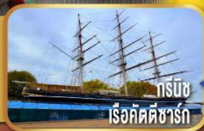
ทรีมิช เรือคัตชาร์ก

ชมเมืองลิเวอร์พูล พร้อมถ่ายรูป หน้าสนามแอนฟิลด์