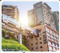
รถไฟฟ้าตึก

ไฮไลท์! เขียนรักฉงชิ่ง แลนด์มาร์คดังของฉงชิ่ง ชมรถไฟฟ้าทะลุตึก อลังการแสงสีที่หงหยาดตึก