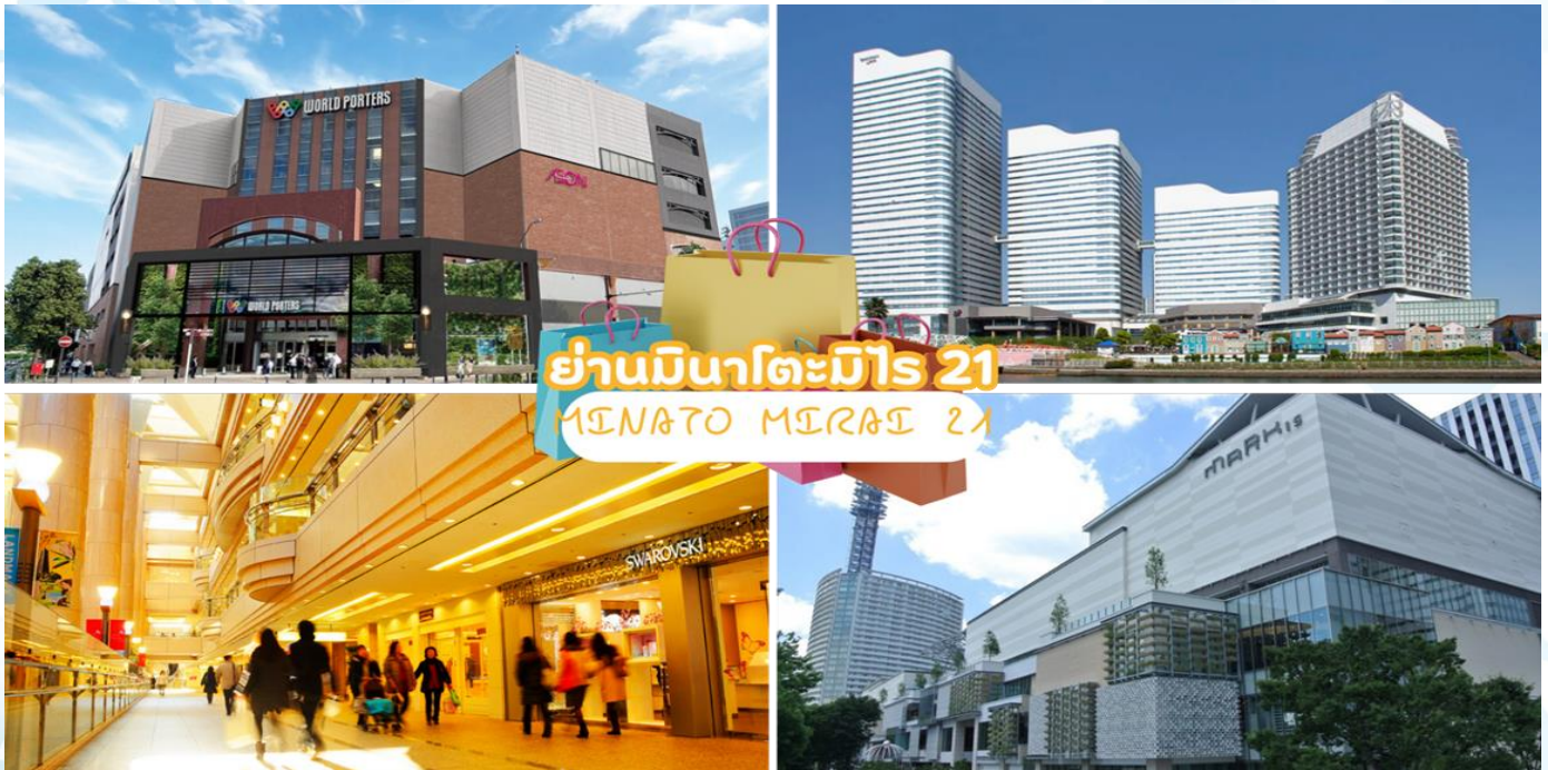
ย่านมินาโตะมิไร 21 MINATO MIRAI 21

หมู่บ้านโอชิโนะฮักไก (Oshino Hakkai Village) เป็นจุดท่องเที่ยวที่สร้างเป็นหมู่บ้านเล็กๆ ที่มีฉากหลังเป็นภูเขาไฟฟูจิ ประกอบด้วยบ่อน้ำ 8 บ่อในโอชิโนะ ตั้งอยู่ระหว่างทะเลสาบคาวากูจิโกะกับทะเลสาบยามานาคาโกะซึ่งเป็นพื้นที่เก่าของทะเลสาบแห่งที่ 6 ที่แห้งขอดไปเมื่อ 200-300 ปีที่ผ่านมา บ่อน้ำทั้ง 8 นี้เป็นน้ำจากหิมะที่ละลายในช่วงฤดูร้อน ที่ไหลมาจากทางลาดใกล้ๆภูเขาไฟฟูจิผ่านหินลาวาที่มีรูพรุนอายุกว่า 80 ปี ทำให้น้ำใสสะอาดเป็นพิเศษ ถัดไปอีกบ่อหนึ่ง นักท่องเที่ยวสามารถดื่มน้ำเย็นจากแหล่งน้ำได้โดยตรง นอกจากนี้ยังมีร้านอาหาร ร้านจำหน่ายของที่ระลึก และซุ้มรอบๆบ่อที่ขายทั้งผัก ขนมหวาน ผักดอง งานฝีมือ และผลิตภัณฑ์ท้องถิ่นอื่นๆ บางร้านยังขายมันเทศหวานย่าง และขนมแฮมเบ้ บนเตาเล็กๆ กลางแจ้งส่งกลิ่นหอมชวนให้ลิ้มรสอีกด้วย