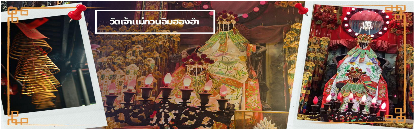
วัดเจ้าแม่กวนอิมสองอ้า

ท่านชม โรงงานจิวเวอรี่ ซึ่งเป็นโรงงานที่มีชื่อเสียงที่สุดของฮ่องกงในเรื่องการออกแบบเครื่องประดับ อาทิเช่น จี้ และแหวนกำหัตน์ ที่สวยงามโดดเด่นไม่เหมือนใคร ซึ่งถือกำเนิดขึ้นที่นี่และมีชื่อเสียงที่สุดใช้เป็นเครื่องประดับติดตัว และเสริมดวงชะตา สินค้าทุกชิ้นมีเอกสารรับประกันคุณภาพเปลี่ยน ซ่อม ด้ตลอดอายุการใช้งาน หากเกิดการชำรุดจากสินค้าไม่ใช่อุบัติเหตุ และนำท่านเลือกซื้อ เครื่องประดับที่ ร้านปีเซี่ยะ ซึ่งคนจีนนั้นถือว่าปีเซี่ยะ หรือเผ่เย้า ที่ทำจากหยกที่เป็นตัวแทนของความสวยงามและความบริสุทธิ์ มีความเชื่อว่าหยกมีพลังมงคล เสริมอายุยืนและสุขภาพดี และปีเซี่ยะในตำนานลูกหลานมังกร ช่วยหาเงินหาทอง กินไม่รู้จักอิ่ม เชื่อว่าเป็นสัตว์นำโชค สู้ครว้เรือน