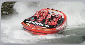
สนุกกับเรือ Shotover Jet