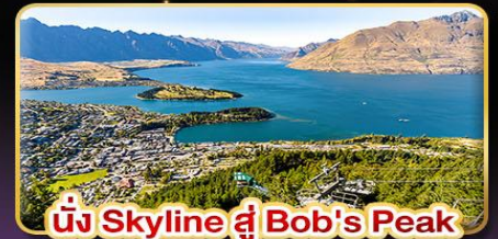
นั่ง Skyline สู Bob's Peak