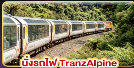
นั่งรถไฟ TranzAlpine