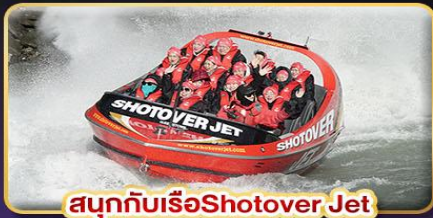
สนุกกับเรือ Shotover Jet