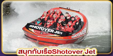
สนุกกับเรือShotover Jet