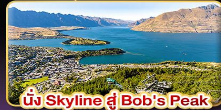
นั่ง Skyline สู Bob's Peak