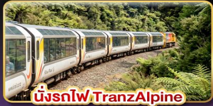
นั่งรถไฟ TranzAlpine