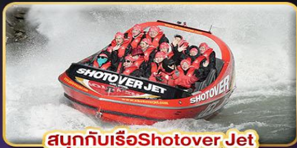
สนุกกับเรือShotover Jet