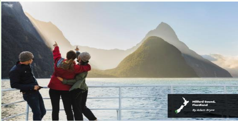
Milford Sound, Fiordland By Adam Bryce

ให้ท่านสัมผัสกับความงามของธรรมชาติโดยรอบ ซึ่งเกิดจากจากเคลื่อนตัวของเปลือกโลก ประกอบกับบรรยากาศเย็นจากขั้วโลกใต้ และสายน้ำกักตุนเขา ส่งผลให้เกิดเป็นชายฝั่งเว้าแหว่ง ทำให้เกิดทัศนียภาพอันงดงามบริเวณชายฝั่ง ตื่นตาตื่นใจกับภาพของสายน้ำตกอันสูงตระหง่านของ น้ำตกโบเวน ซึ่งมีความสูง 160 เมตร จากหน้าผา พบกับแมวน้ำนอนอาบแดดบนโขดหินอย่างสบายอารมณ์