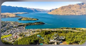
นั่ง Skyline สู่ออสเตรีย Bob's Peak