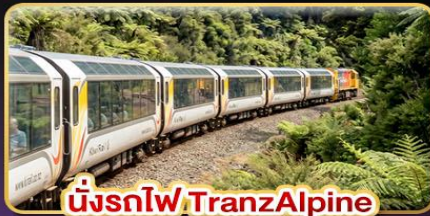
นั่งรถไฟ TranzAlpine