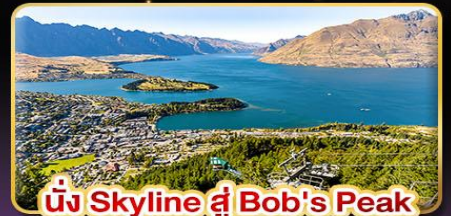
นั่ง Skyline สู่ Bob's Peak