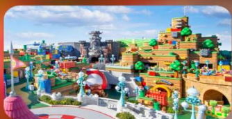
อิสระท่องเที่ยว