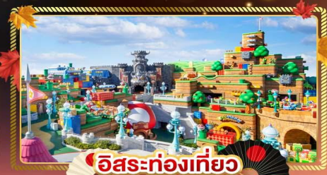
อิสระท่องเที่ยว