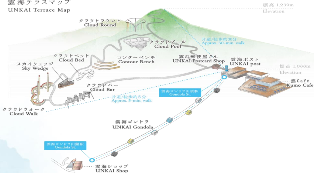
雲海テラスマップ UNKAI Terrace Map

เดินทางสู่ เมืองอาซาฮิคาว่า เป็นเมืองที่ใหญ่เป็นอันดับสองของเกาะฮอกไกโด รองจากนครซัปโปโระมี ร้านค้าที่ขายข้าวและผักที่ปลูกได้ในเมือง และยังมีร้านอาหารทะเลตั้งอยู่มากมาย การคมนาคม สมบูรณ์แบบ ทำให้แต่ละปีมีผู้มาท่องเที่ยวกว่า 5 ล้านคนจากทั้งในและต่างประเทศ