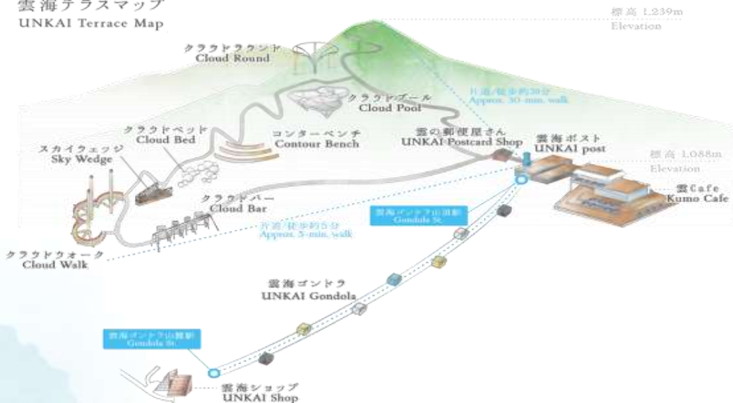
雲海テラスマップ UNKAI Terrace Map

เดินทางสู่ เมืองอาซาฮิคาว่า เป็นเมืองที่ใหญ่เป็นอันดับสองของเกาะฮอกไกโด รองจากนครซัปโปโระมีร้านค้าที่ขายข้าวและผักที่ปลูกได้ในเมือง และยังมีร้านขายอาหารทะเลตั้งอยู่มากมาย การคมนาคมสมบูรณ์แบบ ทำให้แต่ละปีมีผู้มาท่องเที่ยวกว่า 5 ล้านคนจากทั้งในและต่างประเทศ