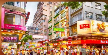
จิมซาจ้วย