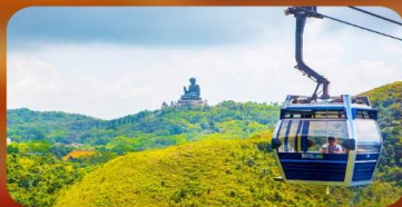
กระเช้ามองปิง