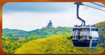
กระเซ่านองปิง