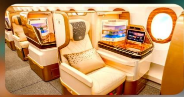
BUSINESS CLASS "บินกลับ"