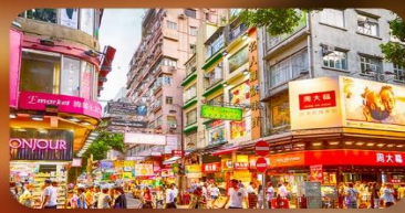
จิมซาจู้