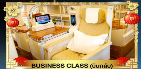
BUSINESS CLASS (บินกลับ)

น้ำหนักกระเป๋า ขาไป 30Kg. | ขากลับ 40Kg.