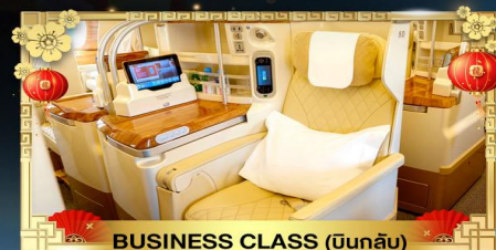
BUSINESS CLASS (บินกลับ)

น้ำหนักกระเป๋า ขาไป 30Kg. | ขากลับ 40Kg.