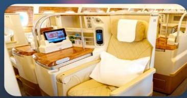
BUSINESS CLASS "บินกลับ"