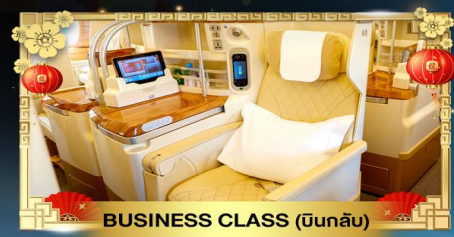
BUSINESS CLASS (บินกลับ)