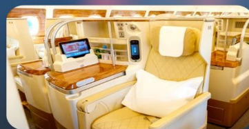
BUSINESS CLASS "บินกลับ"