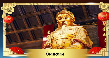
วัดเขากง

เข้าร่วมพิธีเปิดทองพระคลังเจ้าแม่กวนอิมสองอำ “เปิดดวงเศรษฐี 1 ปีมีครั้งเดียว” บินทรูกลับแบบเศรษฐี BUSINESS CLASS