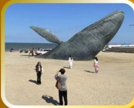
ประติมากรรมวาฬยักษ์ดิน