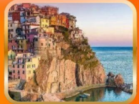
หมู่บ้านประมงชาวจีนโอเชี่ยน