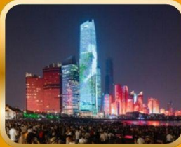
NO. 3 BATHING BEACH LIGHT SHOW