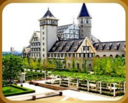
คฤหาสน์นางอยู่