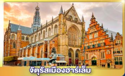
จัตุรัสเมืองฮาร์เล็ม

พรมแดนเมืองแปลกเนเธอร์แลนด์และเบลเยียม เดินเมืองเคลฟท์ เมืองเครื่องปั้นดินเผาระดับโลก ฮาร์เล็มเมืองมั่งคั่งที่สุดของเนเธอร์แลนด์