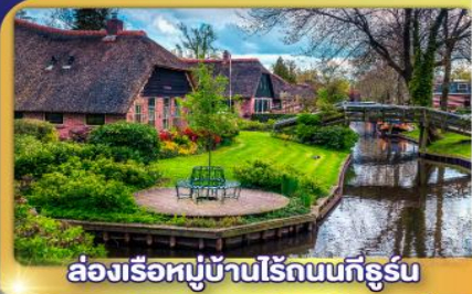
ล่องเรือหมู่บ้านโรกนทกัธร์น