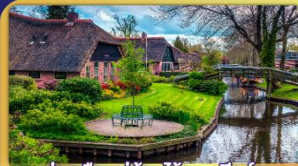
ล่องเรือหมู่บ้านโรกนทึร์ธึน