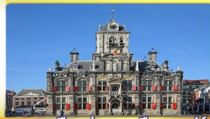
อาคารเมืองท่าคลองเมืองเคลฟท์