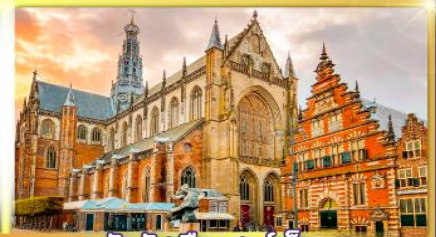
จัตุรัสเมืองฮาร์เล็ม

พรมแดนเมืองแปลกานเนเธอร์แลนด์และเบลเยียม เดินเมืองเคลฟท์ เมืองเครื่องปั้นดินเผาระดับโลก ฮาร์เล็มเมืองมั่งคั่งที่สุดของเนเธอร์แลนด์