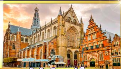
จัตุรัสเมืองฮาร์เล็ม

พรมแดนเมืองเปลาเกนเนเธอร์แลนด์และเบลเยียม เติมนเมืองคลุฟท์ เมืองเครื่องปั้นดินเผาระดับโลก ฮาร์เล็มเมืองมั่งคั่งที่สุดของเนเธอร์แลนด์