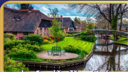
ส่องเรือหมู่บ้านโรกกันนักรูร์น