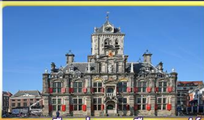
อาคารเมืองท่าคลองเมืองคลุฟท์