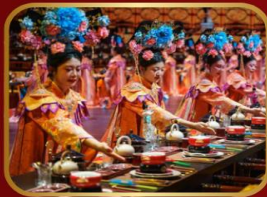
ภัตตาคารวังหลวง YU XIAN DU