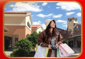
อิสระช้อปปิ้ง BEIJING OUTLET