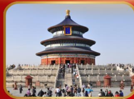
ชมความงดงาม หอฟ้าเทียนถาน