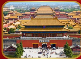
เขื่อนมรดกโลก พระราชวังกู้กิง