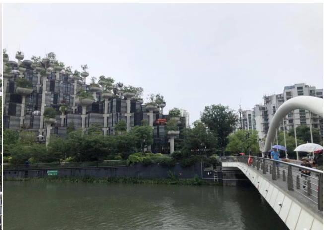
BW NIHAO SHANGHAI – HANGZHOU (Premium) 6D4N by TG-Aug-Dec26-New Year26 ลัพเทท 14-5-26