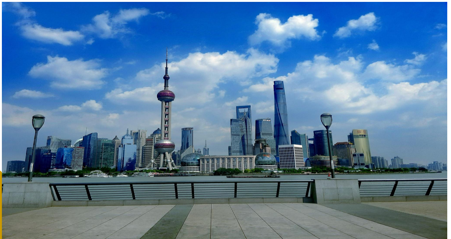
BW NIHAO SHANGHAI – HANGZHOU (Premium) 6D4N by TG-Aug-Dec26-New Year26 ลัฟเทศ 14-5-26

นำท่านเดินทางสู่ เดอะบันด์หรือหาดไ่วทาน หาดแต่ไม่ใช่หาดที่เป็นชายทะเล แต่เป็นทางเดินเลียบบริเวณแม่น้ำ บรรยากาศโดยรอบเต็มไปด้วยอาคารบ้านเรือนเก่าแก่ที่เป็นสถาปัตยกรรมแบบยุโรป ซึ่งเป็นย่านอาคารสไตล์ยุโรปงดงามที่มีความเก่าแก่กว่าร้อยปีตั้งเรียงรายอยู่บนถนนริมแม่น้ำ หวงฝูอาคารเหล่านี้เป็นอาคารที่สร้างขึ้นตั้งแต่สมัยที่เชียงใหม่ยังเป็นเขตเช่าของประเทศต่างๆ ปัจจุบันก็ใช้เป็นโรงแรม เป็นที่ทำการธนาคารแห่งชาติหลายๆแห่ง รวมไปถึงยังเป็นที่ทำคารกงสุลไทย และธนาคารกรุงเทพ สาขาเชียงใหม่ของไทย