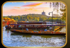
ล่องเรือ ทะเลสาบซีหู