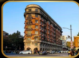
ถ่ายรูปจุดเช็กอิน WUKANG MANSION