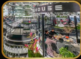
ภัตตาคารชื่อดัง WAREHOUSE NO.3