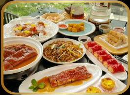
อาหารระดับ มิชลิน TAO TAO JU