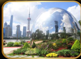
จุดถ่ายรูปยอดฮิต NORTH THE BUND