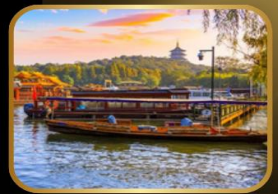
ล่องเรือ ทะเลสาบซีหู