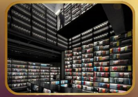
ชมร้านหนังสือ PAGE ONE