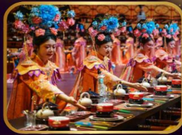
ก๊อตตาคารวังหลวง YU XIAN DU