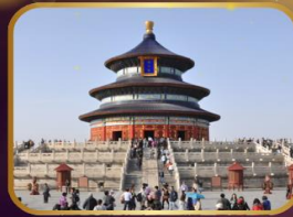
ชมความงดงาม หอฟ้าเทียนถาน