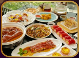
อาหารระดับ มิซลิน TAO TAO JU