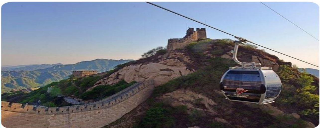
BW SAWASDEE BEIJING 5D4N (ขึ้นกระเช้า กำแพงเมืองจีน) (TG614-615) on Jun-Dec 26 อัปเดต 14-5-26

นำท่านเดินทางสู่ กำแพงเมืองจีน "ด้านป่าดำหลัง" (นั่งกระเช้าขึ้น-ลง) กำแพงเมืองจีนป่าดำหลังเป็นที่รู้จักในฐานะด่านตรวจที่ยิ่งใหญ่ 1 ใน 9 แห่งของโลก ทัศนียภาพของกำแพงเมืองจีนผสมผสานความสง่างามและความชันเข้ากับทิวทัศน์ที่สวยงามและเขียวชอุ่ม ถือเป็นแก่นแท้ของกำแพงเมืองจีนแห่งราชวงศ์หมิง "ผู้ที่ไม่เคยไปกำแพงเมืองจีนไม่ใช่คนที่ไม่จริง" ชาวจีนจำนวนมากเลือกสถานที่นี้เป็นตัวเลือกหลักในการปีนกำแพงเมืองจีนด้านกำแพงเมืองจีนป่าดำหลังมีรูปร่างคล้ายสี่เหลี่ยมคางหมู ทางทิศตะวันออกแคบ ทางทิศตะวันตกกว้าง โดยมีประตู 2 แห่งทางทิศตะวันออกและทิศตะวันตก ประตูทางทิศตะวันออกมีจารึกว่า "เมืองจุหยงไวย" และประตูทางทิศตะวันตกมีจารึกว่า "กุญแจประตูทางทิศเหนือ" กำแพงเมืองจีนที่ทอดตัวไปทาง