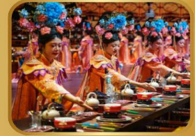
ภัตตาคารวังหลวง YU XIAN DU