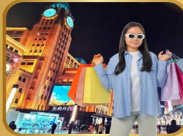
แหล่งช้อปปิ้งชื่อดัง WANGFUJING STREET