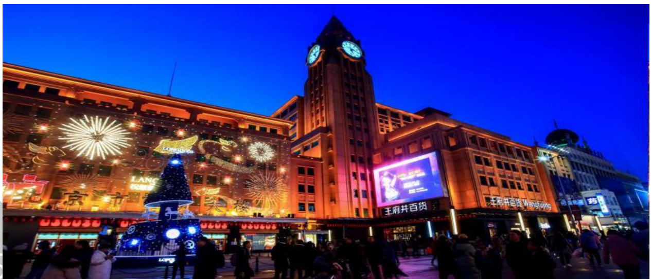
BW ปักกิ่ง เมืองโบราณกุเป่ยสุยเงิน 5D4N(Premium) by TG on Aug-Dec26-New Year26 สัปดาห์ 14-5-26

นำท่านเดินทางสู่ ถนนหวังฝูจิ่ง ถนนกลางคืนที่มีชื่อเสียงของปักกิ่ง นำท่านสัมผัสชีวิตและแสงสียามค่ำคืนของนครปักกิ่ง ตลาดถนนคนเดินทางแห่งกรุงปักกิ่งที่รวบรวมสินค้าอันหลากหลายไม่ว่าจะเป็นข้าวของเครื่องใช้ เสื้อผ้า และอาหารที่ขึ้นชื่อยอดนิยมของชาวจีน ไปจนถึงอาหารแปลกตาที่หารับประทานยาก ถือได้ว่าเป็นหนึ่งในเอกลักษณ์ และสีสันอันคึกคักของถนนหวังฝูจิ่ง โดยสถานที่ไฮไลท์ที่ห้ามพลาด ถนนอาหารแปลก เป็นตรอกเล็กๆ ที่เปิดเฉพาะช่วงกลางคืน มีสารพัด อาหารแปลกๆ มากมาย อาทิ ตะขบ แมงป่อง ปลาดาว ม้าน้ำ หอยเม่น ซึ่งคนจีนเชื่อว่าเป็นอาหารที่บำรุงร่างกาย นอกจากนี้ ยังมีร้านขาย "ขนมปังถึงหู" ขนมหวานโบราณยอดนิยมของชาวจีนนั่นเองลงบันไดเลื่อนภายในห้างหวังฝูจิ่ง