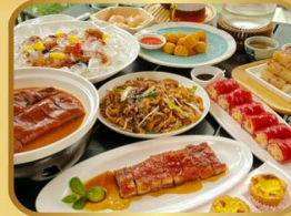
อาหารระดับ มิชลิน TAO TAO JU