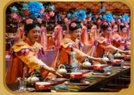
ภัตตาคารวังหลวง YU XIAN DU