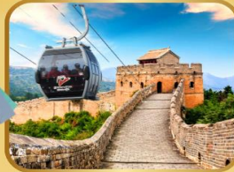
กำแพงเมืองจีน ด่านซือหม่าโต (รวมกระเช้า)