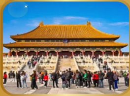
พระราชวังกู้กง THE FORBIDDEN CITY