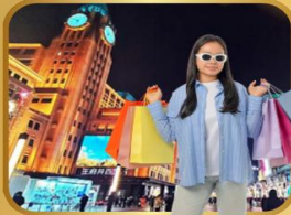
แหล่งช้อปปิ้งชื่อดัง WANGFUJING STREET