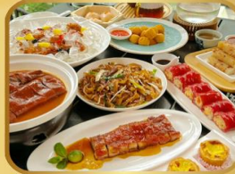
อาหารระดับ มิชลิน TAO TAO JU