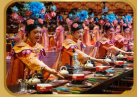
ภัตตาคารวังหลวง YU XIAN DU