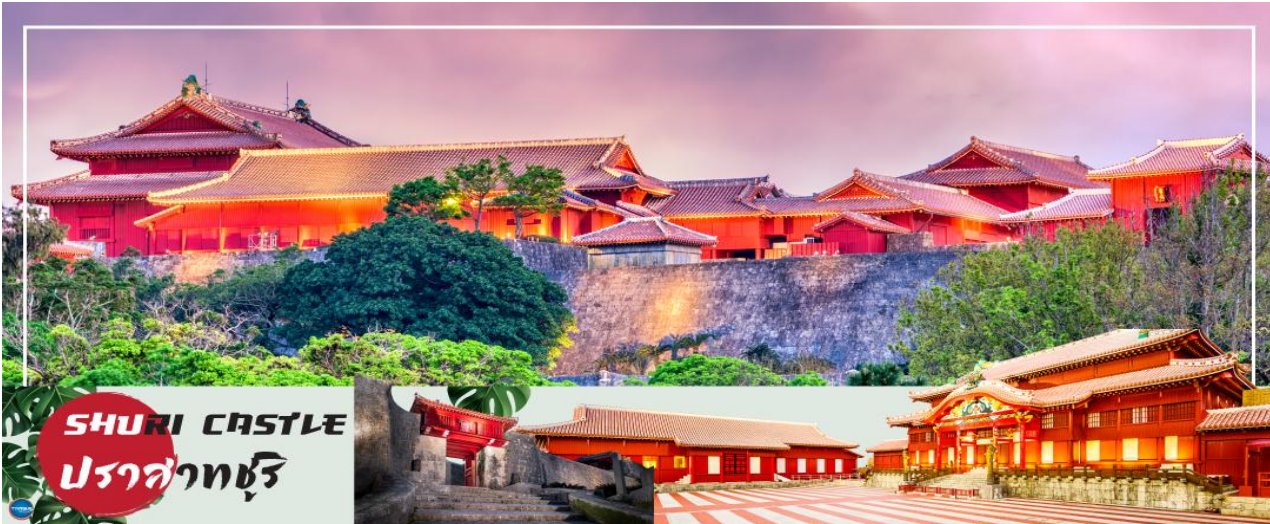
SHURI CASTLE ปราสาทชुरิ

วันที่สาม ปราสาทชुरิ (ด้านนอก) – ดิวตี้ฟรี – โอกินาวาเวิลด์ – ถ้ำอารมรดกเกียวคุเซ็นโด – โรงงานแก้ว – ศูนย์การค้าอิมิจิ เทอเรส