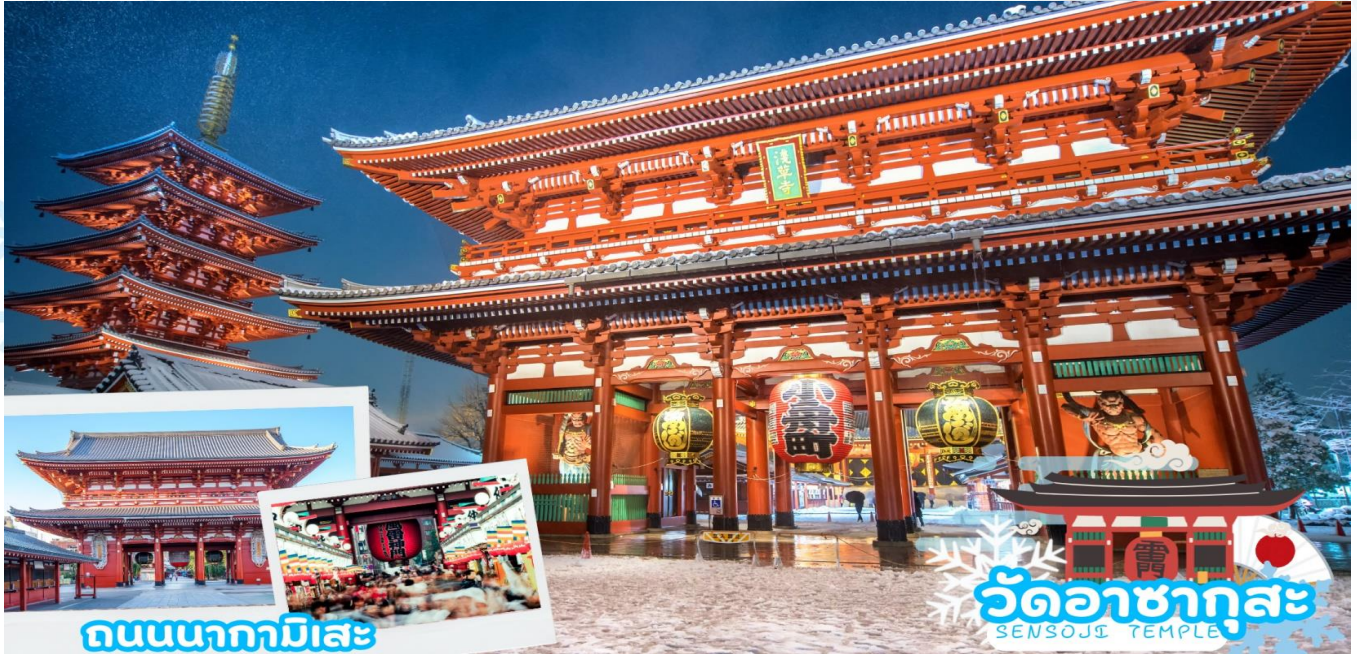
ถนนนากามิเสะ

เช้า รับประทานอาหารเช้า ณ ห้องอาหารภายในโรงแรม (มื้อที่ 9)