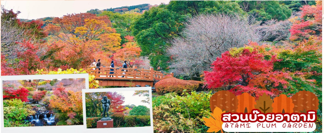
สวนบ๊วยอาตามิ ATAMI PLUM GARDEN

รับประทานอาหารเช้า ณ ห้องอาหารของโรงแรม (มื้อที่ 4)