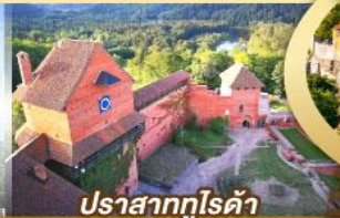
ปราสาทกูโรดา