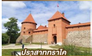
ปราสาททราโค