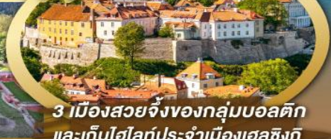
3 เมืองสวยจิ้งของกลุ่มบอลติก และเก็บไฮไลท์ประจำเมืองเอสซิงกิ และล่องเรือเฟอร์รี่ข้ามประเทศ