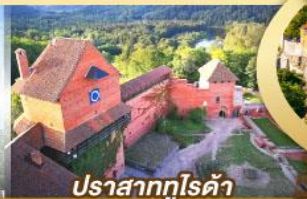
ปราสาทกูโรดา