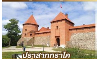
ปราสาททราโค