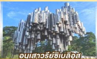
อนุสาวรีย์ซีเบลึส