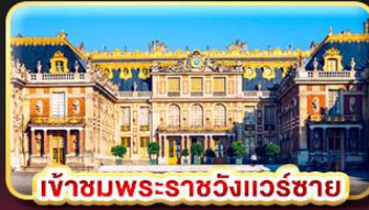
เข้าชมพระราชวังแควร์ซาย