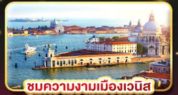
ชมความงามเมืองเวนิส