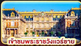
เข้าชมพระราชวังแวร์ซาย