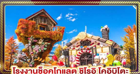
โรงงานช็อคโกแลต ชิโรอิ โคอิบิตะ