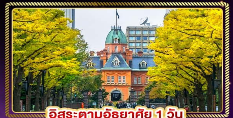
อิซะระตามอริยาตสึ 1 วัน

น้ำหนักกระเป๋า 20 Kg. บริการอาหาร บนเครื่องบิน