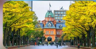
ฮิระะตามอริยาซัย 1 วัน