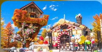
โรงงานช็อกโกแลต ชิโรอิ โคอิชิโตะ