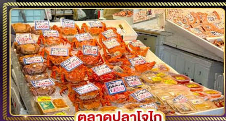
ตลาดปลาโอ