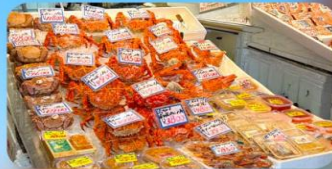
ตลาดปลาโจโก