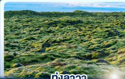
ทุ่งลาวา