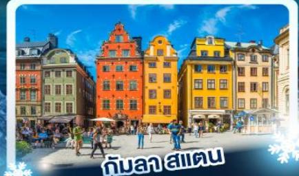
กินลา สแตน