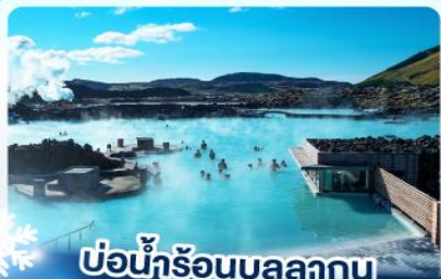
แช่น้ำร้อนบลูลากูน

เก็บไอซ์แลนด์ แคนกูเขาไฟคีร์กจูเฟล และ แช่น้ำร้อนบลูลากูน