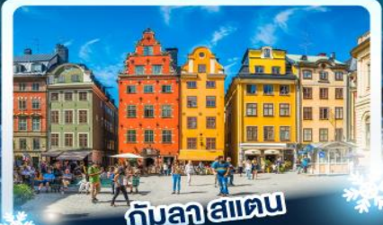
กินลา สแตน