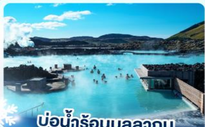
แช่น้ำร้อนบลูลากูน

เก็บไอซ์แลนด์ แคนกูเขาไฟคีร์กจูเฟลา และ แช่น้ำร้อนบลูลากูน