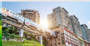
รถไฟฟ้าทะลุถ้ำ