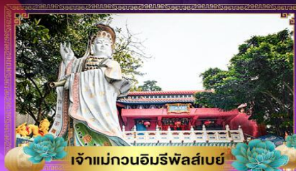
เจ้าแม่กวนอิมรพีลัสเบย์