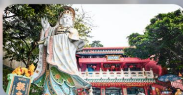
เจ้าแม่กวนอิมรีฟัลส์เบย์