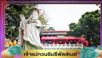
เจ้าแม่กวณโถมรพีลส์เบย์