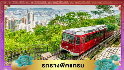
รถรางพิคทแกรม