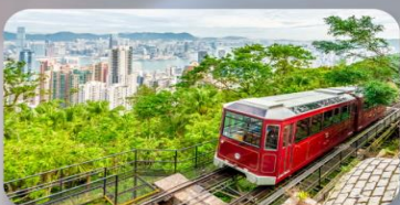
รถรางพิคเกรม